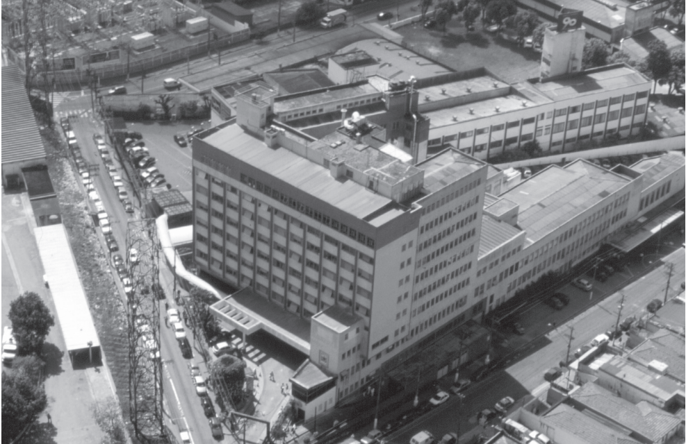
Complexo Hospitalar São Cristóvão